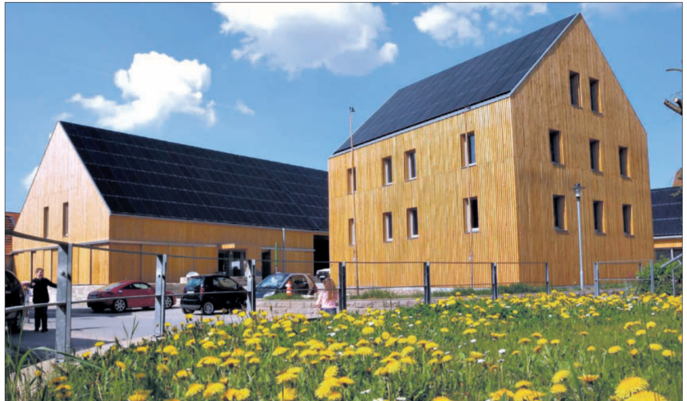
Der Hof8 mitten im Ortskern – neue Heimat für das Lebenshaus mit Hebammenpraxis, die Klärle GmbH und zwei barrierefreien Wohnungen.