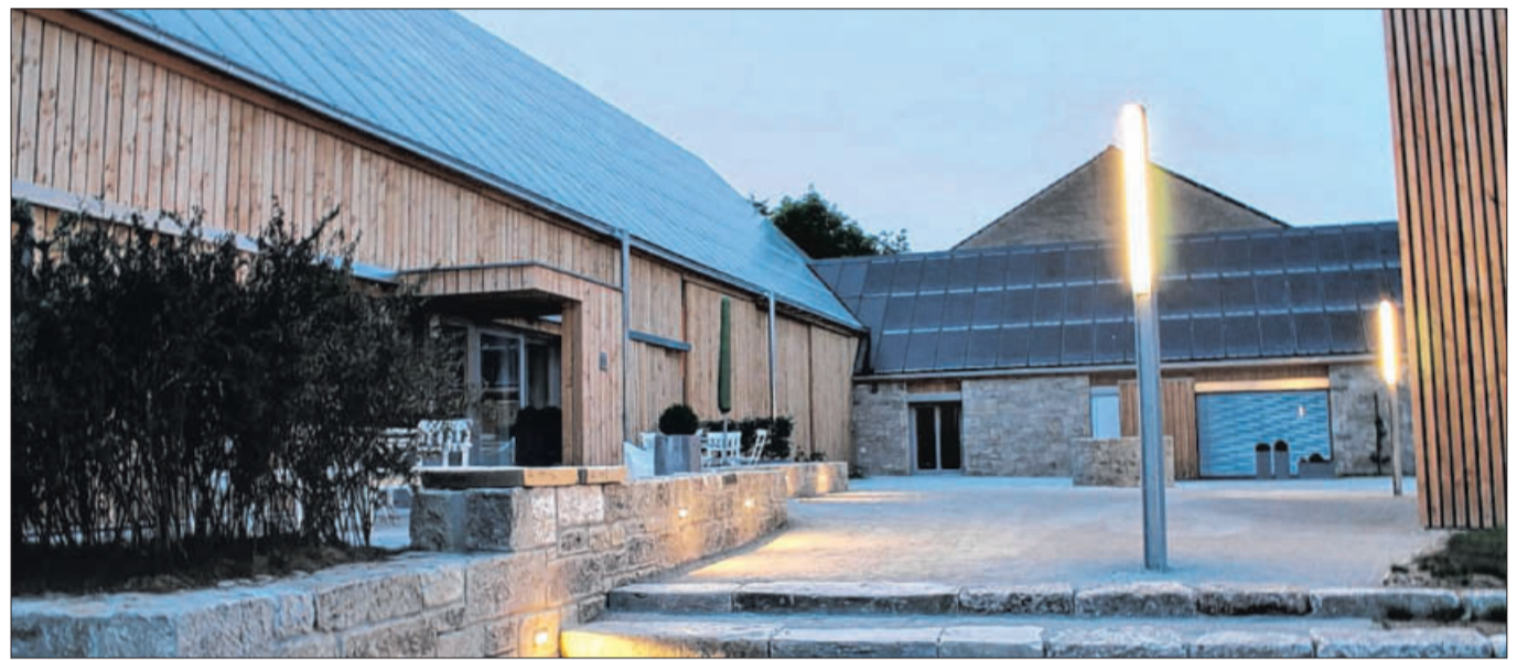
Modernste Baukultur in historischen Gebäuden – so kann eine vorbildliche, leistungstarke Symbiose aussehen.