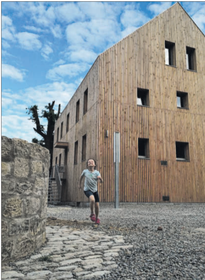
„Geboren werden – arbeiten – alt werden“: Motto des Hof8.